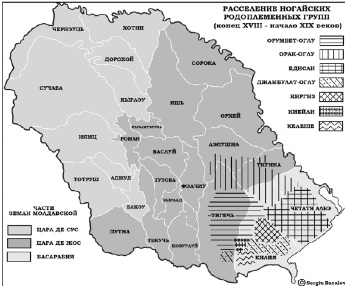
Карта № 2